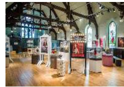
Musée des Deux-Rives

La Société d'histoire et de généalogie des Quatre Lieux invite ses membres et la population de la région à une visite du secteur historique de Valleyfield. Voyage par autobus: départ à 8h00 du stationnement de l'église de Saint-Césaire. Le retour est prévu vers 17h00. Le coût de l'activité est de 50$ par personne et comprend le transport en autobus et toutes les visites guidées de la journée. Païement à l'avance ou avant le départ le matin du 31 juillet 2024.